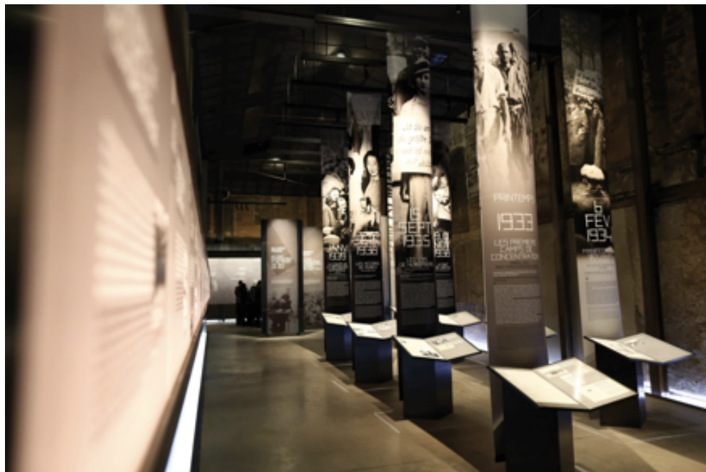
Le volet historique, 2014

l'organisation muséographique du Mémorial en trois volets. Nous sommes ici dans le premier, le volet historique, avec une première galerie consacrée à l'entre-deux guerres, à la montée des périls.