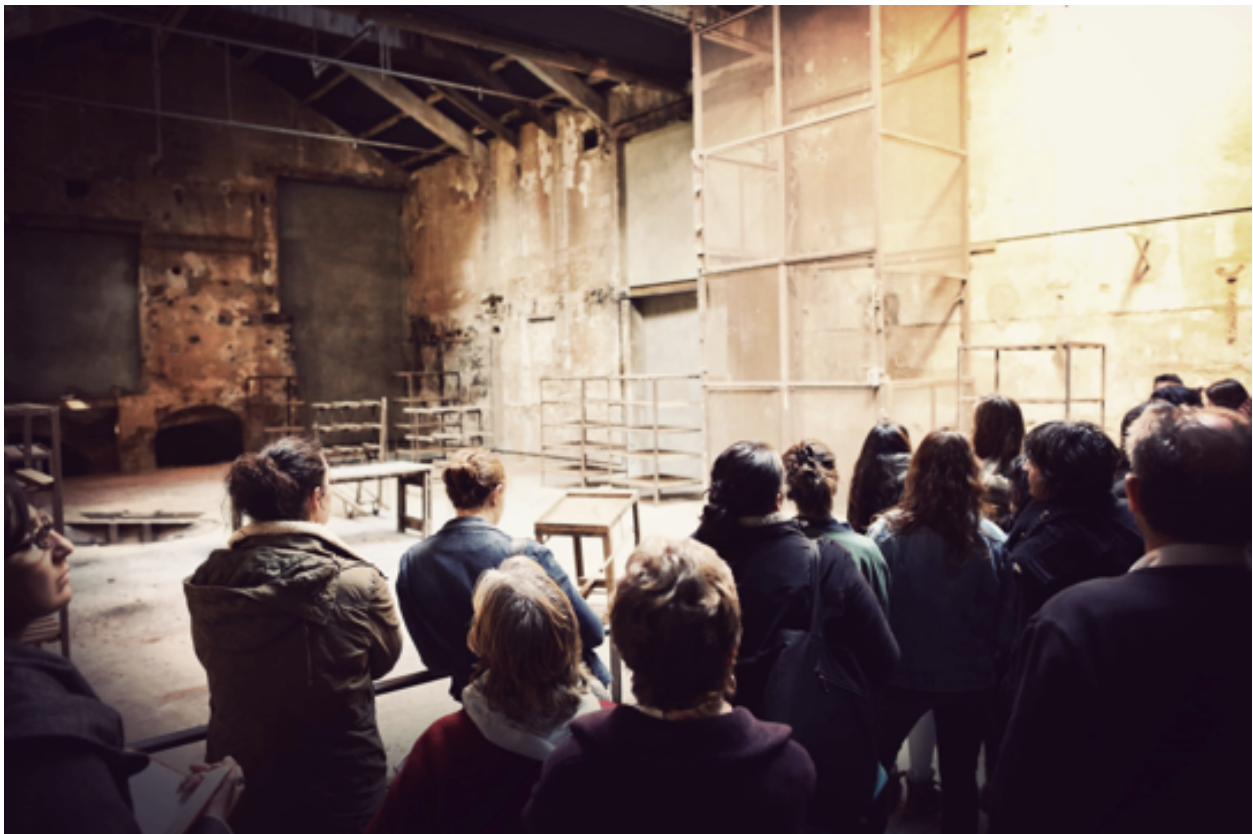
Devant la salle des séchoirs