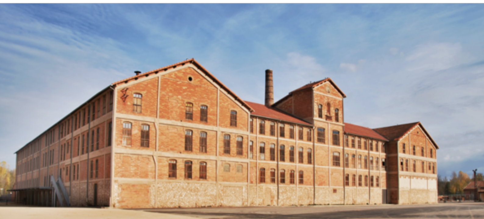
La façade du Camp des Milles. 2014