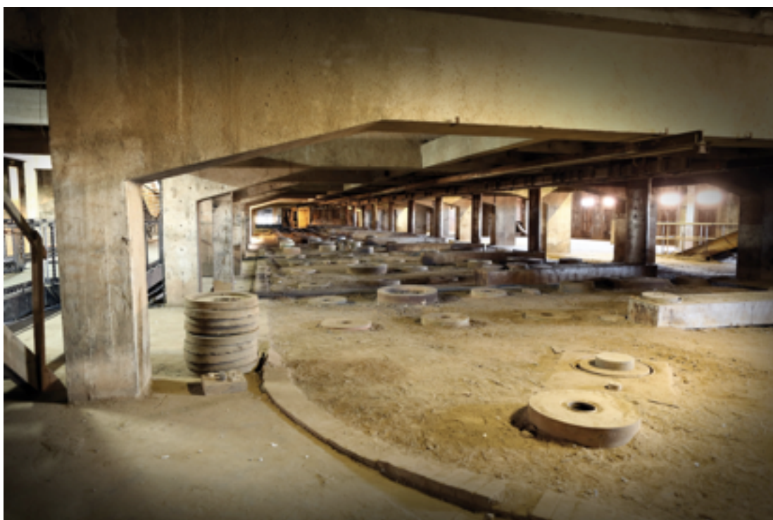
Le volet mémoriel : l'étage de l'internement des femmes et des enfants

Bernard Mosse : On va accéder maintenant au deuxième étage - qui a été ouvert pour la troisième période, au moment de l'internement des femmes et des enfants pour la déportation, les dortoirs des hommes et des vieillards étant toujours aux étages inférieurs.