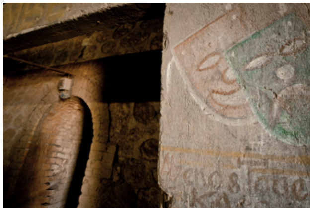
Volet mémoriel : A l'étage des hommes