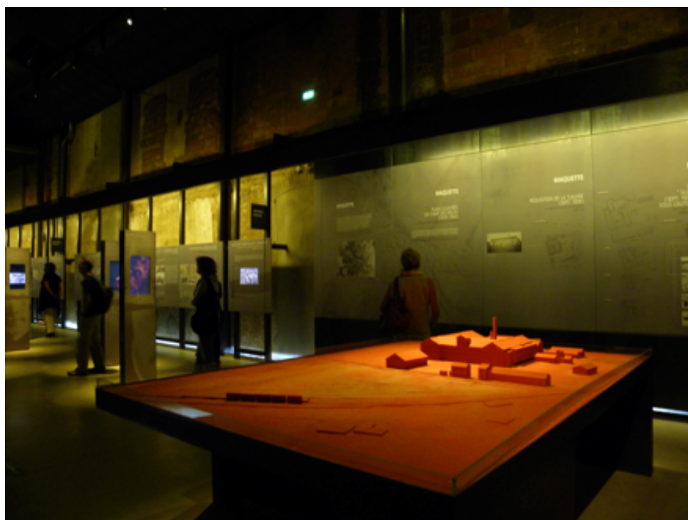
La maquette du Camp dans la galerie historique du Mémorial, 2014

Nous traversons rapidement cette partie pour nous rendre à la maquette du Camp des Milles qui inaugure l'histoire du Camp proprement dite que je vais résumer.