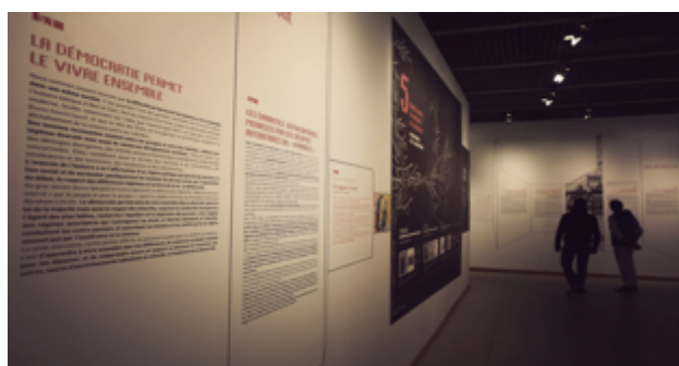
Le Volet réflexif. Les panneaux