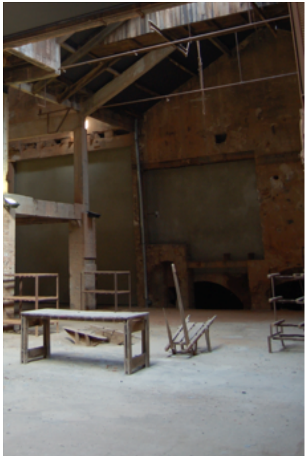
Le Volet historique du Mémorial des Milles : le puits de lumière

C'est pourquoi donc je parlais d'une mise en scène. Et il faut essayer d'imaginer qu'au moment de l'activité, soit jusqu'en 1938, et puis après à nouveau en 1947, il y avait là des postes de travail, les presses et le moulage des formes.