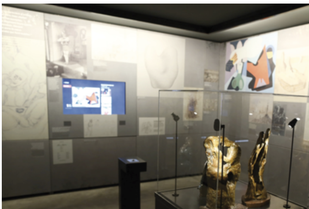
Le Volet historique du Mémorial des Milles : Les unités de destin et les documents de contextualisation

entre le propos principal avec les trois périodes successives, et on rentre dans l'histoire du camp proprement dite qui est racontée sur les panneaux de droite. Au centre, vous avez ce qu'on appelle des unités de destin qui rendent compte du destin individuel d'internés plus ou moins connus, comme Max Ernst qui est le plus connu des artistes internés ici. Et puis il y a deux espaces d'approfondissement, sur le régime de Vichy et sur le camp des artistes.