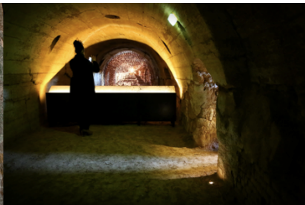
Volet mémoriel : les traces actuelles du cabaret Die Katakombe

Bernard Mosse : Voilà encore une station importante où, comme je l'ai dit tout à l'heure, on mêle à l'histoire du camp l'histoire industrielle. On est ici à l'étage des hommes. Le rez-de-chaussée et le premier étage sont des endroits d'internement d'hommes pour les deux premières périodes du Camp. Il y a eu 10.000 internés ici en tout, et jusqu'à plus de 3.000 en même temps, avec des conditions d'hygiène, une seule toilette au départ, un seul robinet d'eau... Donc évidemment ici c'est la puanteur, c'est le typhus, les bestioles, la dysenterie, etc. Ils dorment sur le sol, on distribue des paillasses quand ils arrivent, et ils dorment à même le sol ici, dans les couloirs, et puis peu à peu dans le four.